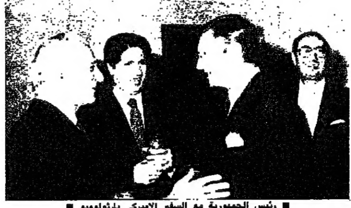
رئيس الجمهورية مع السفير الإسرائيلي بلوثوميو

من الطبيعي جدا ان يبقى لبنان على اتصال مع الراي العام الاقليمي والدولي طلبا مساعده لتخطي هذه المرحلة الصعبة من تاريخه، خصوصا انه صاحب حق في استعادة سيادته على ارضه وفي العودة الى الحياة الطبيعية ليمارس دوره كقوة متوازنة بين الشرق والغرب، وليكون له صوته المسموع في المحافل الدولية، وفي وقت يتسابق فيه العالم على المزيد من التسلح وتكثيف الاسلحة المدمرة، بدلا من الانصراف الى تحقيق المزيد من فرص السلام وحل المشاكل الاجتماعية والاقتصادية التي تتلألأ اكثر من منطقة في العالم، ومن حق لبنان على الدول التي تتادي بحقوق الانسان، والتي وقعت على شريعة حقوق الانسان في الامم المتحدة، من حقه على هذه الدول ان يطالبها بتنفيذ ما تؤمن به، فلا تبقى الدول المستغففة تحت رحمة احتلال من هنا او من هناك، وتتدخل في شؤونها الداخلية، واستعمال اكثر وسائل الازهاق تطورا ضد الانسان وضد وحدة الارض والشعب كما يحصل تماما على الأراضي اللبنانية منذ عشر سنوات ان لم يكن اكثر.